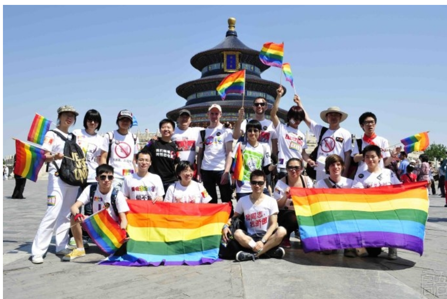
2011 年北京“流动的彩虹”在天坛

2009 年之后，“流动的彩虹”的活动方式陆续被多个地方的组织借鉴，517 国际不再恐同日“面向公众倡导反恐同、反歧视”的主旨更是得到不断的推广。2011 年中国大陆有 17 个地区的 22 个同志小组在 5 月做了相关活动，相信这条“流动的彩虹”必将继续传承下去。