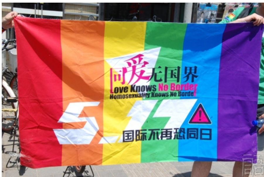
2009年北京“流动的彩虹”横幅

国际不再恐同日（International Day Against Homophobia，缩写为 IDAHO）定于每年 5 月 17 日，是为了纪念 1990 年的这一天，世界卫生组织将“同性恋”从精神病名录中去除。在加拿大和法国的积极分子推动下，2005 年“IDAHO 国际委员会成立”，呼吁世界各国在每年的 5 月 17 日开展各种各样的倡导活动，唤醒公众关注因恐惧同性恋和歧视性倾向而产生的暴力行为及不平等对待，唤起社会对恐同现象的关注。