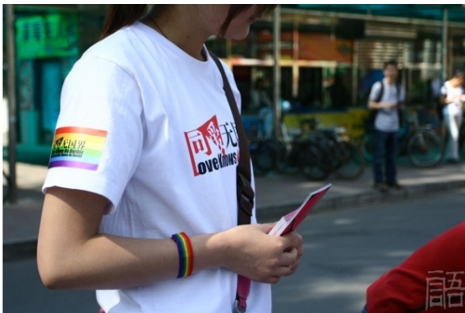
2009 年来自学生社团的活动志愿者

为消除车手志愿者暴露身份的疑虑，也为了突出 517“反对恐同，不分你我”的公益精神，招募启事特别强调这是一次不论性别和性身份的活动，欢迎具有各种自我认同的志愿者参加。这一“同直联合”的策略收到了良好效果，大量异性恋学生也踊跃报名。