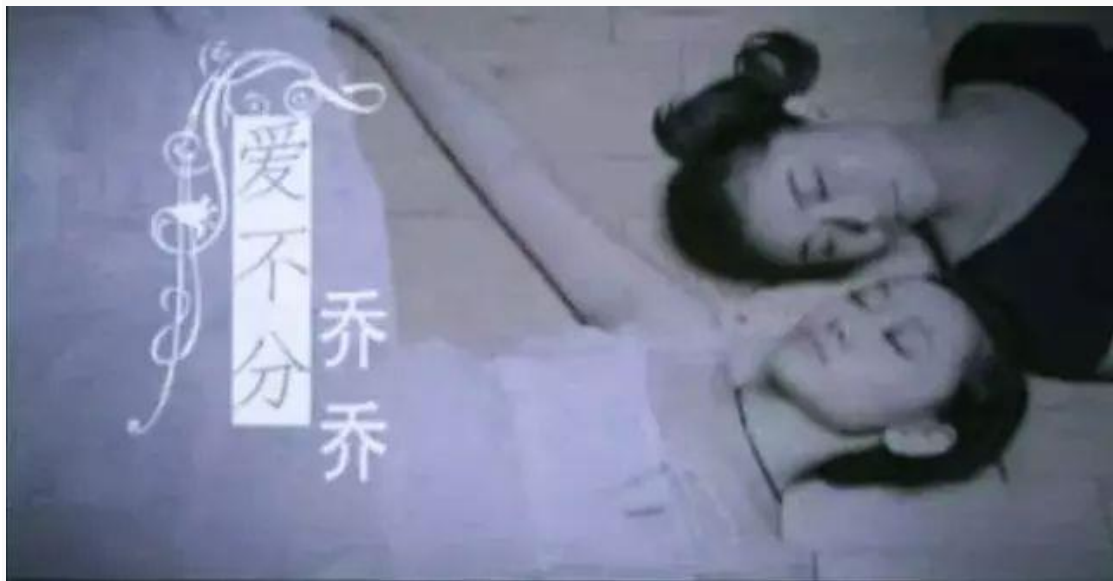
乔乔的歌曲作品《爱不分》

在前文中已经讲到乔乔认为在男同女同一起聚会的同志酒吧里，拉拉在人数上明显很少，并“被逼到一个角落”，所以有了开一个拉拉专属酒吧的念头。