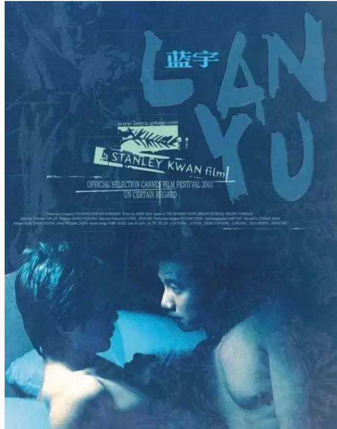
由刘烨和胡军主演的电影《蓝宇》海报

卡斯特曾在他的《网络社会的崛起》一书中讲到，电视节目是按照所有观众的最低认知标准制作的。如果是电影作品还具有某种先锋性的话，那么电视节目所呈现的是更为接近社会现实的状态。所以从这个意义上讲， 同性恋议题进入中国的电视节目能够更有力地说明这个议题的日益凸显以及社会公众的关注不断加强。而正是从 2000 年开始，同志议题进入到了中国大陆的电视圈。2000 年 8 月，石头成为了中国大陆第一个在电视上公开出柜的女同志。石头作为大陆的代表与香港的陈鲁豫、台湾的阿哲（台湾晶晶同志书店的店长）共同参加了凤凰卫视的“一点两岸三地谈”节目，讨论了一些同性恋话题。2002 年凤凰卫视共制作并播放了两期有关同性恋的节目，《名人面对面》和《冷