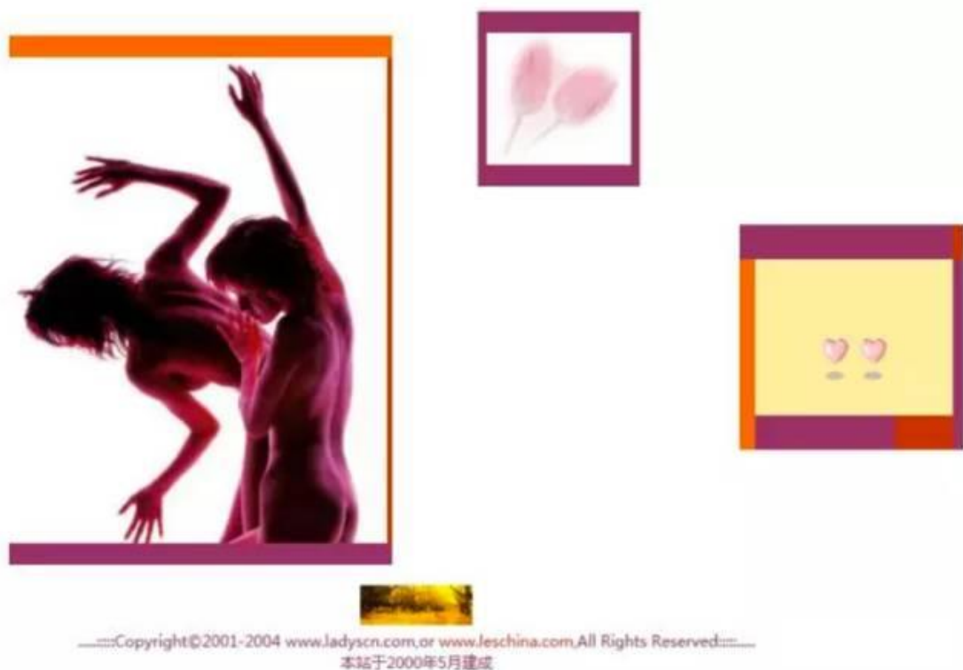
深秋小屋 2001-2004 年首页截图

现，例如深秋小屋、花开的地方、阿拉岛等等。到 2002 年，“咸丰年间”统计并记录的拉拉网站达到了 30 多家。在这些大陆自己的拉拉网站发展的同时，上网的拉拉人数也在不断地增加。北京的拉拉开始出现每个礼拜六晚上集体上网聊天找人的情况。网上的活动也逐步发展出了线下的聚会与活动，有讨论会，也有到郊外的旅游活动。